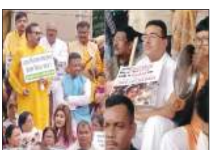
श्री। जब नेता प्रतिपक्ष शुभेंद्रु अधिकारी विधानसभा में अपना काम खत्म कर वापस लौट रहे थे तब उन्हें देखकर तृणमूल विधायकों ने थाली बजाना शुरू

टीएम एक्शन इंडिया/कोलकाता पश्चिम बंगाल विधानसभा का शीतकालीन सत्र फ़िलहाल चल रहा है। गुरुवार को भी सारा दिन सदन के अंदर जमकर हंगामा हुआ है। बंगाल के बकाए के भुगतान की मांग पर सत्तारूढ़ पार्टी तृणमूल कांग्रेस पिछले तीन दिनों से डाकट प्रभारवा अंबेडकर की प्रतिभा के सामने बैठकर विधानसभा में विरोध प्रदर्शन कर रही है। आज भी यह प्रदर्शन जारी