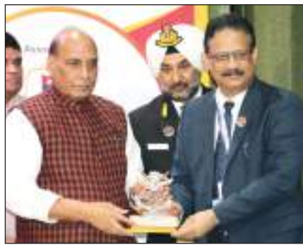
नई दिल्ली में आयोजित एक कार्यक्रम में केंद्रीय रक्षा मंत्री राजनाथ सिंह शामिल होते हुए।