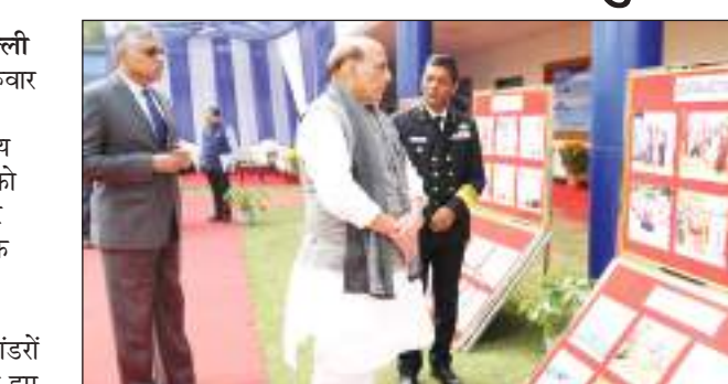
कि आईसीजी ने अपनी स्थापना के बाद से सभी परिस्थितियों में नाविकों की सुरक्षा सुनिश्चित करने के बारे में उनकी महत्वपूर्ण सेवा की है। उन्होंने प्रतिबद्धता पदार्थ

टीएम एक्शन इंडिया/नई दिल्ली रक्षा मंत्री राजनाथ सिंह ने गुरुवार को भारतीय तटरक्षक बल (आईसीजी) से देश की तटीय सुरक्षा और समुद्री क्षमताओं को मजबूत बनाने की दिशा में पूरे समर्पण और पेशेवर अंदाज के साथ लगातार काम करने का आह्वान किया है। उन्होंने नई दिल्ली में 40वें तटरक्षक कमांडों के सम्मेलन का उद्घाटन करते हुए खोज, बचाव और प्रदूषण प्रतिक्रिया के क्षेत्र में अग्रणी रहकर समुद्री सुरक्षा सुनिश्चित करने के लिए भारतीय तटरक्षक बल की प्रशंसा की। राजनाथ सिंह ने कहा