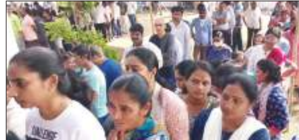
में 63.94 प्रतिशत मतदान होने की आधिकारिक पुष्टि हुई है। शहरों की तुलना में ग्रामीण इलाकों में मतदान प्रतिशत अधिक रहा। सुबह से ही सुस्त चल रहे मतदान ने शाम को रफ्तार पकड़ी। सबसे अधिक मतदान प्रतिशत

टीएम एक्शन इंडिया/हैदराबाद तेलंगाना में विधानसभा चुनाव के लिए मतदान का समय समाप्त हो गया है। छिटपुट घटनाओं को छोड़कर माहौल शांतिपूर्ण रहा। शाम 5:00 बजे तक 63.94 प्रतिशत मतदान होने की खबर है। माओवादियों से प्रभावित विधानसभा क्षेत्रों में मतदान शाम चार बजे समाप्त हो गया। बाकी 106 सीटों पर सुबह 7 बजे से शाम 5 बजे तक मतदान जारी रहा। पांच बजे तक कतार में लगे लोगों को मतदान करने दिया गया। कई स्थानों पर मतदाता मतदान केंद्रों के सामने कतार में खड़े हैं। आज शाम पांच बजे तक राज्यभर